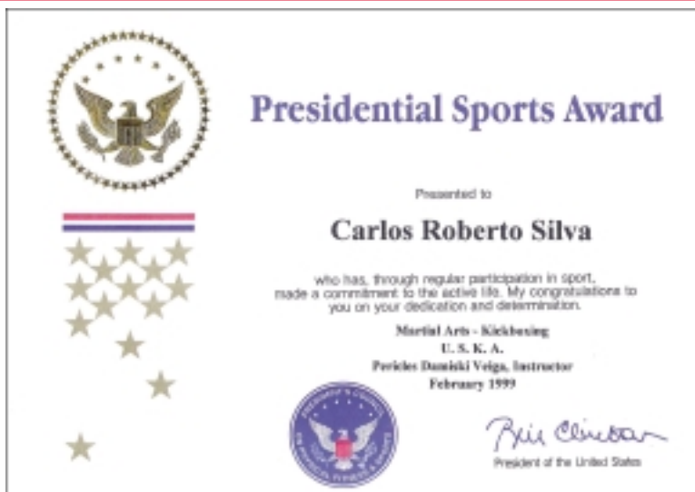
Diploma assinado por Bil Clinton. presidente dos Estados Unidos da América